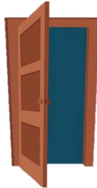
Van zorg naar gewoon leven